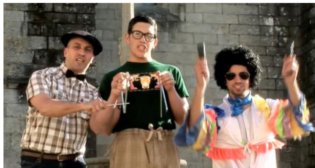
Fotogramas de los vídeos realizados (2010)