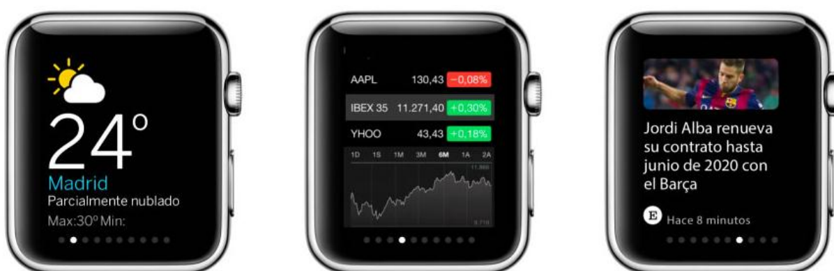
Imagen 3. App para iWatch del diario El País

El Mundo , Le Figaro y Le Monde , pensando en las características de esta nueva pantalla, optan por ofrecer exclusivamente títulos y subtítulos. Contemplan la opción de continuar con la lectura en el iPhone o de guardar la información para su consulta posterior.