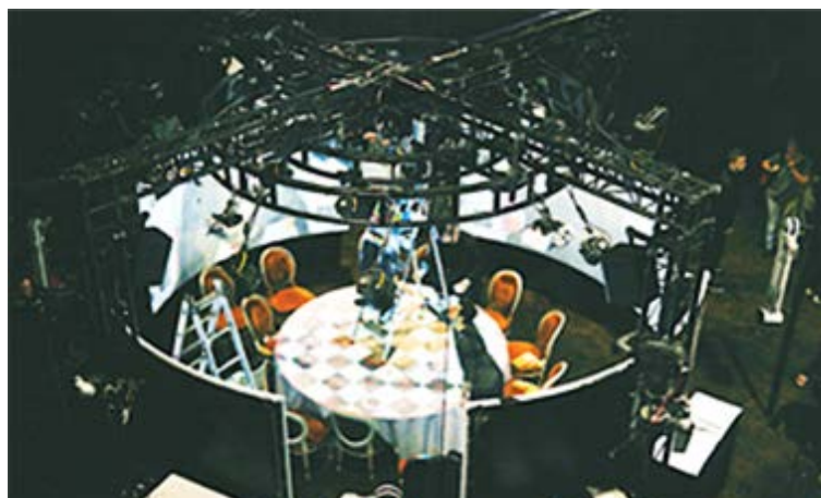
Fig. 1. Disposición técnica de "El Somni"

La zona no visible, la cocina, solo es accesible al personal y está claramente aislada de las escenas visibles. En “El Somni”, la cocina se utiliza como un laboratorio secreto cerrado, no como un escenario teatral abierto a la vista de los clientes. Durante el experimento, los chefs permanecen ocultos para los invitados, preparando los doce platos diferentes en su cocina remota. Esto revela la forma en que los Roca conciben su contribución al experimento: se niegan a interrumpir el espectáculo y así romper la ilusión que crea. De la misma manera que los cocineros no están en el escenario principal de la actuación, el papel de los camareros también es muy limitado en este mismo escenario: traen silenciosamente los platos a los invitados. Aquí, sin el acabado de los platos delante de los invitados, el personal es casi invisible. Todo parece estar hecho para que los invitados se centren en el espectáculo que ocurre en la mesa y detrás de ellos, y dejarlos solos con la disposición.