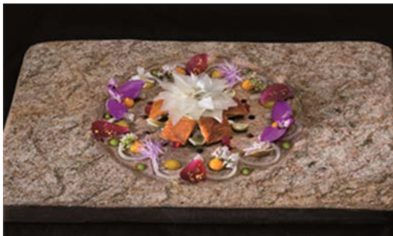
Fig. 3. El plato de «mandala»