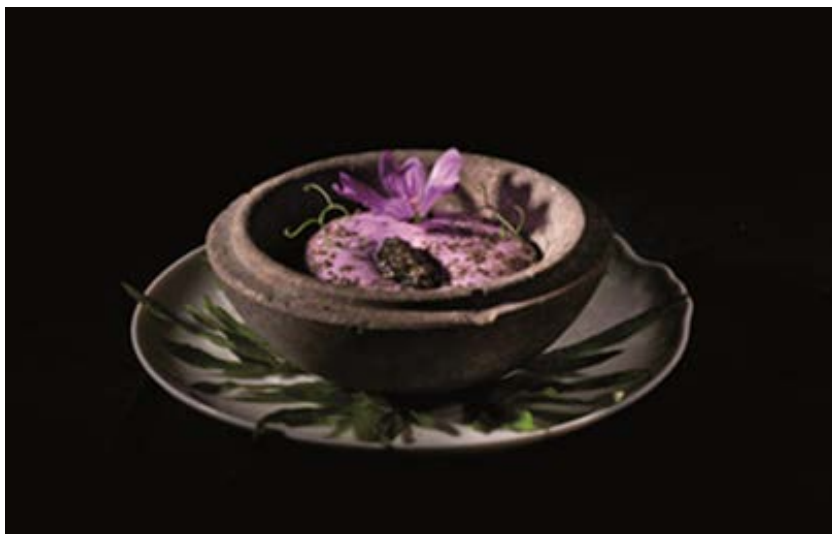
Fig. 4: El plato “Piedad/Muerte”

humo de incienso y artemisa para evocar el olor de la piedra fría. Este plato evoca una pequeña tumba abierta: es la idea de la muerte y entierro convertido en un plato.