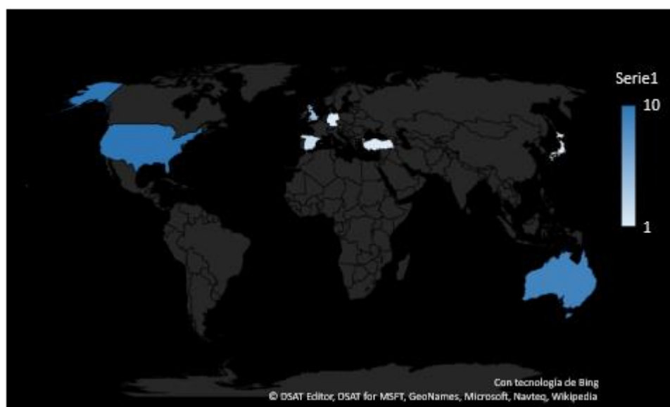
Gráfico 4. Mapeo geográfico de los artículos encontrados, según primer firmante.

En cuanto a la procedencia de artículos, según adscripción del primer firmante, el mayor número proviene de EE. UU. (10), seguido por Australia (9), Reino Unido (4), España (2), Alemania (1), Turquía (1) y Japón (1) (gráfico 4).