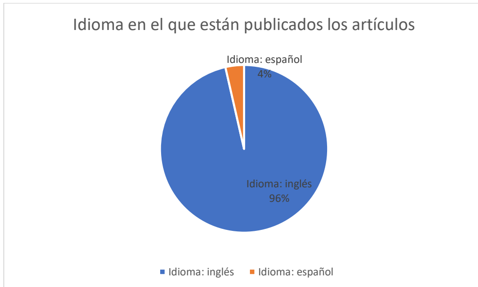
Gráfico 2. Idioma de los artículos

De los 28 artículos que forman parte de la muestra, 27 de ellos están escritos en inglés, mientras que tan solo 1 de ellos está escrito en español (gráfico 2).