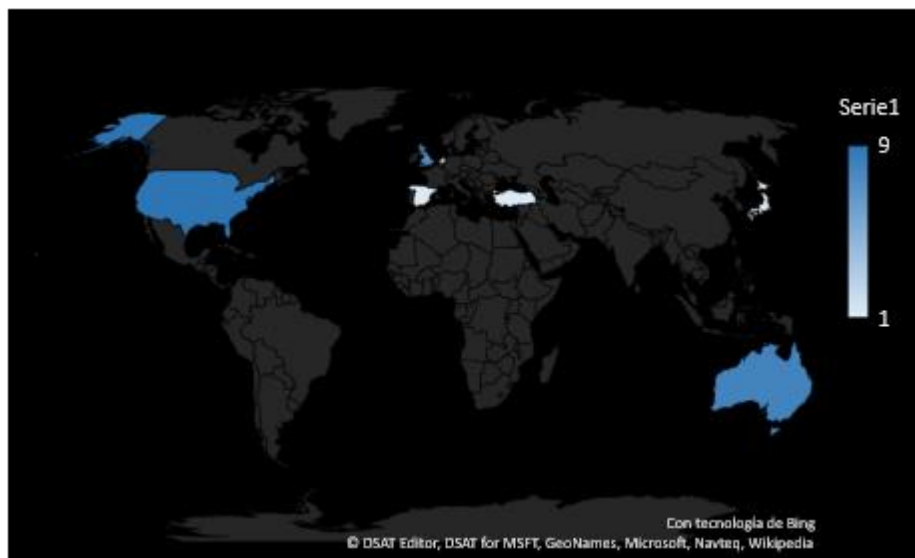
Gráfico 3. Mapeo geográfico de los artículos encontrados, según país de publicación.

En cuanto al país de publicación, son países de habla inglesa en donde se visibiliza el mayor número de artículos: Estados Unidos es el país en el que más artículos se han publicado sobre la materia (9), seguido por Australia (8) y Reino Unido (7); con un solo artículo estarían 4 países: España, Turquía, Japón y Holanda (Gráfico 3).