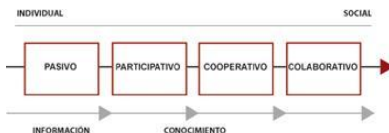
Figura 2. Clasificación del usuario respecto a su comportamiento

Por último estaría la Generación I que hace referencia a los usuarios de más de 73 años de edad. De esta clasificación se puede señalar que por norma general, como ya se ha dicho anteriormente, se suele distinguir seis perfiles de edad con su correspondiente modo de comportamiento. En este sentido, no olvidando el objeto de investigación original, se puede concluir que el perfil dominante formaría parte de la llamada Generación X y de la Generación Y. Por otro lado, respecto al comportamiento del usuario, y muy relacionada con la clasificación en función de la experiencia, en la Web se distinguen cuatro actitudes: pasivo, participativo, cooperativo y/o colaborativo.