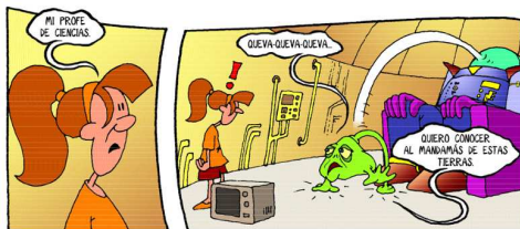
Imagen 2: El Tirano Marciano (p. 12)