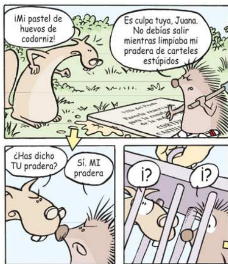
Imagen 1: Ordoño y Juana (p. 5)