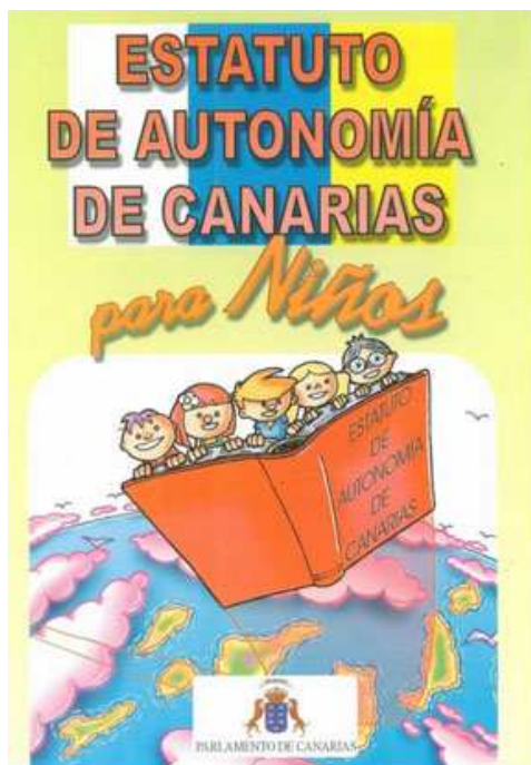
Imagen 4: Estatuto de Autonomía de Canarias para niños (portada).

Resultaría absurdo no contemplar estos dos libros fuera de este texto, porque aunque nos hemos ceñido a la definición más estricta de lo que es un cómic, el lenguaje del noveno arte puede ser empleado también en otros soportes y productos comunicativos. No nos detendremos a analizar el relato de estos dos libros (no lo hay, ya que se trata de textos explicativos con ilustraciones y viñetas) ni su target (ya definido desde su título) ni su interactividad (igual que los anteriores). Sólo emplearemos su mención como última pincelada a este estudio, donde se remarca que, a pesar de que la presencia del cómic ha sido escasa –que no insignificante–, también se han encontrado otros productos didácticos cercanos a él, así como otros muchos que por la extensión limitada de este estudio no podremos mencionar.