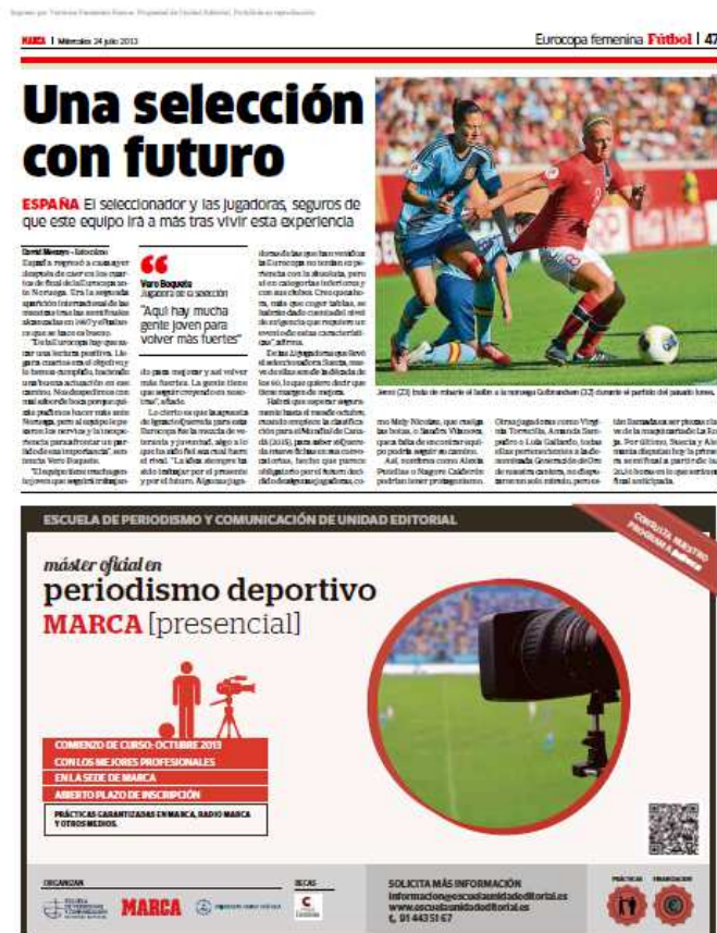
Ilustración 3: El fútbol femenino está en pleno crecimiento.

Boquete, esta última recientemente nominada al balón de oro, han sido las claves para que se vuelva a hablar de fútbol femenino en España.