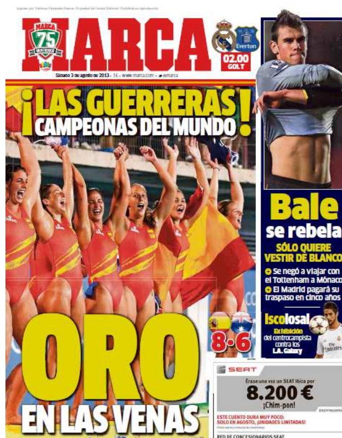
Ilustración 2: La selección de Waterpolo conseguía la medalla de oro en los Mundiales de natación, todo un hito histórico para el deporte femenino.

Tras el éxito de este equipo en los juegos olímpicos de Londres con una medalla de plata, repetían en el Mundial de natación y este año el Europeo consiguiendo el oro. En Londres se las ponía en sobrenombre de “las guerreras”, por lo luchadoras que son dentro del agua. Esta portada es especialmente importante, ya que es la única que se ha dedicado a un éxito de mujeres, pese a que en muchas ocasiones deberían tener más portadas dedicadas.