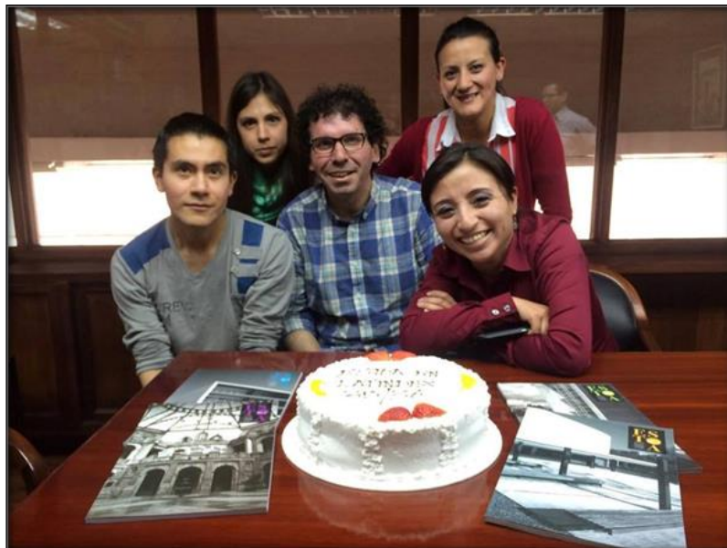
El equipo Estoa celebrando la inclusión de la revista en Latindex (Julio de 2015)

Capes, CiteRevistas, Suncat, RI-Opac, REDIB, UlrichWeb, Sherpa Romeo. Hemos pasado a ser calificados por MIAR (Matriz de Información para el Análisis de Revistas, Universidad de Barcelona) con un Índice Compuesto de Difusión Secundaria de 9,1 sobre 11 puntos posibles, lo que significa que Estoa se encuentra entre las revistas mejor categorizadas de los registros presentes en esta base de datos de evaluación. También hemos pasado a formar parte de Emerging Sources Citation Index, una colección de revistas lanzada por Web of Science, de Thomson-Reuters, la mayor organización de información del mundo. Por tanto, Estoa aparece en el directorio de Web of Science y se pueden localizar sus datos desde la Master Journal List de Web of Science. Estar presente en ESCI significa que Estoa continúa su evaluación para poder ser indexada en las ediciones principales de Web of Science que proveen factor de impacto, siempre que se alcance un número de citas significativo. Recientemente la revista ha sido incluida en Catálogo Latindex, siendo reconocida con el cumplimiento de 35 de los 36 criterios de calidad editorial establecidos para revistas electrónicas.