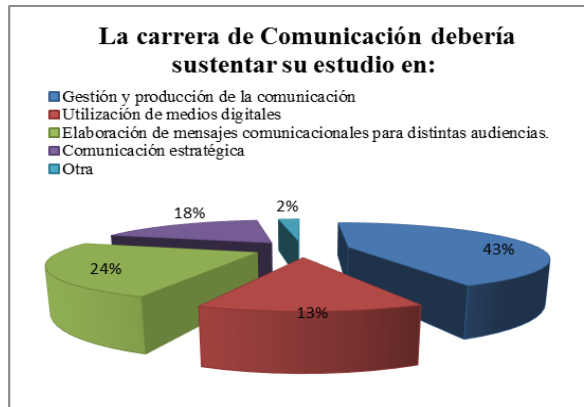
Gráfico 1: Sustento de la carrera de comunicación