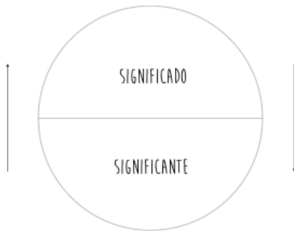
Figura 01: Signo saussureano.