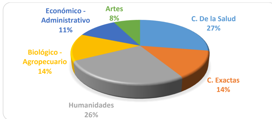
Figura 2. Porcentaje de docentes por área del conocimiento