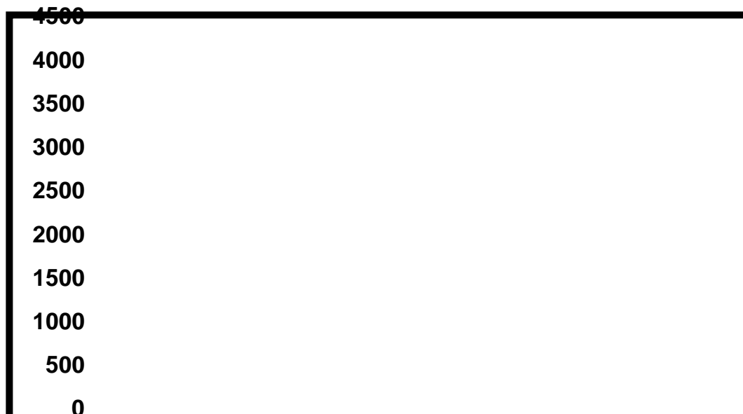
Gráfico 3: Cuota de pantalla comparada de informativos y sátira

Elaboración propia a partir de datos GECA